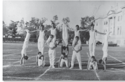
Εικόνες 9, 10. Στιγμιότυπα από σχολικούς αθλητικούς αγώνες στα ΕΕΜ.

Οι δάσκαλοι και οι καθηγητές που κινούσαν αυτήν την εκπαιδευτική διαδικασία επιλέγονταν με μεγάλη προσοχή. Όφειλαν να είναι πτυχιούχοι αναγνωρισμένου διδασκαλείου, ώστε να επιτελούν με επιτυχία το διδακτικό τους έργο, αλλά και να εξασφαλίζεται η αναγνώριση των ΕΚΜ από το ελληνικό Υπουργείο Παιδείας. Στην επιλογή υπολογίζονταν πολύ οι μετεκπαιδεύσεις, η Σχολή αποφοίτησης, η γνώση ξένων γλωσσών και μουσικής ή άλλου αντικείμενου, η προϋπηρεσία και οι συστατικές επιστολές. Τα εμπορικά μαθήματα διδάσκονταν από ειδικούς, ενώ οι ξένες γλώσσες από ξενόγλωσσους εκπαιδευτικούς, οι οποίοι προέρχονταν από κυβερνητικά ή ξένα σχολεία ή ακόμη και από το εξωτερικό. Οπωσδήποτε, οι εκπαιδευτικοί εργάζονταν πολλές ώρες, ενώ δίδασκαν και στα εσωσχολικά φροντιστήρια, για να ενισχύουν το εισόδημά τους. Υφίσταντο αυστηρό έλεγχο και παρέμεναν υπό την εποπτεία της Εφορείας και τη σκιά του παντοδύναμου διευθυντή. Απαραίτητο ήταν, επίσης, να συμπεριφέρονται αξιοπρεπώς, ώστε να εξασφαλίζεται η ευμενής κρίση της παροικίας. Η ΕΚΜ από την πλευρά της τούς παρείχε δυνατότητα μετεκπαίδευσης, με απώτερο στόχο την άνοδο του επιπέδου σπουδών του σχολείου. Μάλιστα, για να εξασφαλίζονται εκπαιδευτικοί αφοσιωμένοι στην ΕΚΜ και με γνώση των ιδιαίτερων συνθηκών του τόπου, στέλνονταν απόφοιτοι των ΕΕΜ ως υπότροφοι στην Ελλάδα, για να σπουδάσουν και στη συνέχεια να υπηρετήσουν στη Μανισούρα.