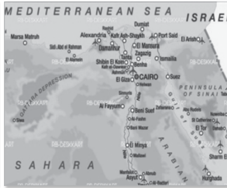
Εικόνες 1, 2. Το Δέλτα του Νείλου σε χάρτη του 1862 (EurAtlas, χ.χ.) και σε μια σημερινή εκδοχή. Πάνω δεξιά, κοντά στο Πορτ Σαϊντ διακρίνεται η Μανσούρα.

Μια τέτοια πόλη ήταν φυσικό να προσελκύσει πολλούς Ευρωπαίους (για τις παροικίες στην Αίγυπτο, βλ. Παπαδημητρίου, 2001b) ανάμεσά τους και Έλληνες. Στον πρώτο ελληνικό πυρήνα που σχηματίστηκε εκεί από τις αρχές του 18ου αι. προστέθηκαν Πελοποννήσιοι αιχμάλωτοι του Ιμπραήμ και κατόπιν μετανάστες από τον ελεύθερο ή τον υπόδουλο ελλαδικό χώρο. Με τον καιρό, οι Έλληνες πάροικοι στη Μανσούρα πλήθυναν. Μάλιστα, δραστηριοποιούνταν κυρίως στον τομέα του εμπορίου, ιδιαίτερα στο βαμβακεμπόριο. Επόμενο ήταν να οικοδομήσουν Εκκλησία και να οργανωθούν σε Κοινότητα. Το 1860 εγκαινιάστηκε ο ναός των Αγίων Αθανασίου και Κυρίλλου. Το ίδιο έτος χρονολογείται και η ίδρυση της δεύτερης, μετά την Κοινότητα Αλεξανδρείας, ελληνικής Κοινότητας 1 (το θεσμικό «πρόσωπο» της παροικίας) στην Αίγυπτο, με τίτλο «Ελληναγυπτιακή Ορθόδοξος Κοινότης Μανσούρας». Το 1893, σχεδόν τριάντα χρόνια μετά, ψηφίσθηκε ο πρώτος Κανονισμός της Κοινότητας ως «Ελληνική» όχι πια ως «Ελληναγυπτιακή». Τότε αναγνωρίσθηκε και από το ελληνικό κράτος (Παπαδημητρίου, 2001c; 2003a; 2004; 2018).