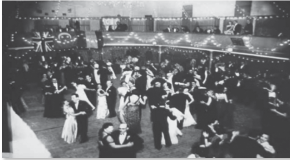
Εικόνα 3. Η ελληνική κοινωνία στη Μανσούρα διασκεδάζει.

κούς οίκους στη δεκαετία του 1920 ήκμαζε. Μάλιστα, ήταν και έδρα Μεικτών Δικαστηρίων 4 , όπου υπηρετούσαν δικαστές διαφόρων εθνικοτήτων ανάμεσά τους και Έλληνες, ενώ γύρω δρούσαν πολλοί Έλληνες δικηγόροι. Όλα αυτά συντέλεσαν στην άνθηση της ελληνικής παροικίας, που είχε ενισχυθεί μετά τη Μικρασιατική καταστροφή από κύμα προσφύγων. Οι Έλληνες συγχρωτίζονταν με την πολυεθνική κοινωνία της πόλης στην Ελληνική Λέσχη και τα πολυτελή κέντρα σε χορούς, διαλέξεις, θεατρικές παραστάσεις και γιορτές, όπως το Σαμ ελ Νεσίμ, μια ολοήμερη γιορτή που οργάνωνε η ΕΚΜ στον κήπο του σχολείου τη Δευτέρα του Πάσχα. Παράλληλα, οι πάροικοι συσπειρώνονταν σε κάθε είδους σωματεία. Συναντάμε τους συλλόγους Ορφεύς, Ένωσις, Ολύμπια, Απόλλων, την Αθλητική Ένωση καθώς και Σώμα Προσκόπων. Στον φιλανθρωπικό χώρο ενεργοποιούνταν, εκτός από την ΕΚΜ, η Φιλόπτωχος Αδελφότης Ελληνίδων Κυριών και η Βιοπάλη (Παπαδημητρίου, 2003c).