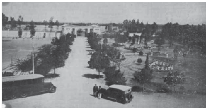
Εικόνα 6. Ελληνικά Εκπαιδευτήρια Μανσούρας. Εξωτερικός χώρος. Στο βάθος τα εντυπωσιακά Προπύλαια. Δεξιά μαθητές γυμνάζονται / χορεύουν. Μπροστά η καράκα και το καρακάκι: τα οχήματα που μετέφεραν τους μαθητές στο εκτός πόλεως σχολείο.