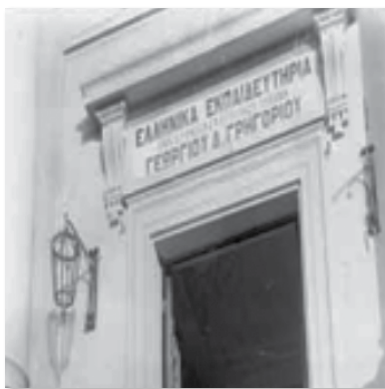
Εικόνες 4, 5. Τα επιβλητικά Ελληνικά Εκπαιδευτήρια Μανσούρας και η κεντρική τους πύλη.