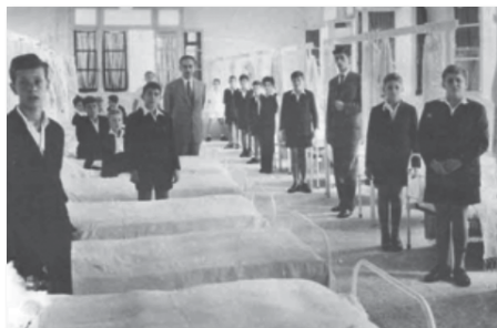
Εικόνες 7, 8. Η τραπεζαρία των ΕΕΜ και οι κοιτώνες του Οικοτροφείου.

Παρουσιάζει ενδιαφέρον να περιγράψουμε πώς κυλούσε μια μέρα στα ΕΕΜ - Οικότροφείο. Τα μαθήματα άρχιζαν στις οκτώ το πρωί, μετά την προσευχή και τον Εθνικό Ύμνο. Διακόπτονταν από τις 12 ως τις 2. Στο δώρο αυτό οι εξωτερικοί μαθητές έτρωγαν στην τραπεζαρία τους το γεύμα που έστελναν οι οικογένειές τους. Οι