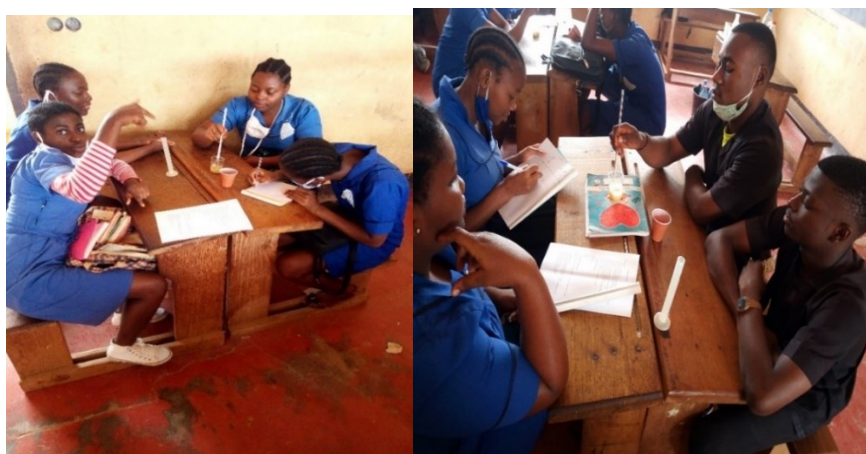
Photographies d'élèves qui manipulent