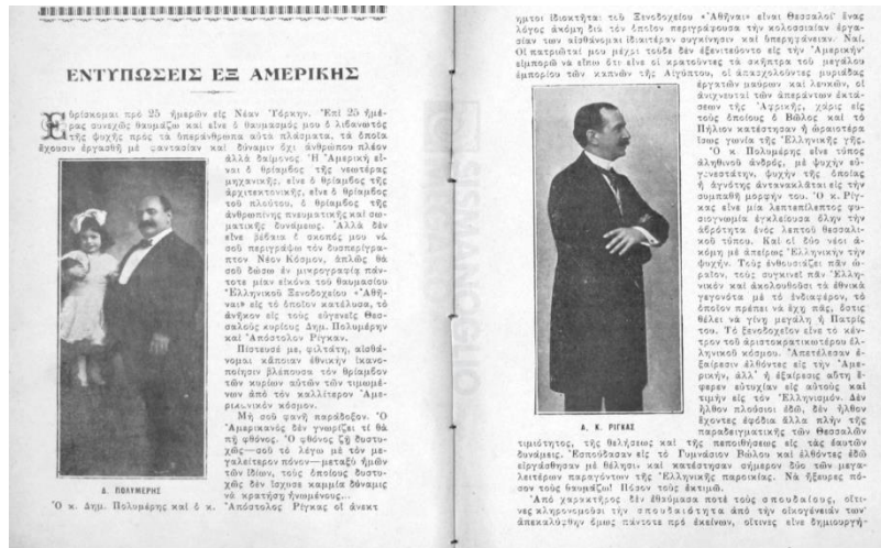
Εικόνα 5. Οι σελίδες από το αφιέρωμα «Εντυπώσεις εξ Αμερικής» της Μαρίκας Πίτιζα-Καρακάση στο «Μικρασιατικό Ημερολόγιο» της εκδότριας Ελένης Σ. Σβορώνου (1916)

Λεπτομέρειες για την επιχειρηματική δράση των Πολυμέρη και Ρίγγα 20 από το ξενοδοχείο «Αθήναι», που στη συνέχεια μετονομάστηκε σε «The Greek Hotel», καταγράφει η Μαρίκα Πίτιζα-Καρακάση ως ανταπόκριση με τίτλο «Εντυπώσεις εξ Αμερικής», που δημοσιεύτηκε στο «Μικρασιατικό Ημερολόγιο» της εκδότριας Ελένης Σ. Σβορώνου το 1916.